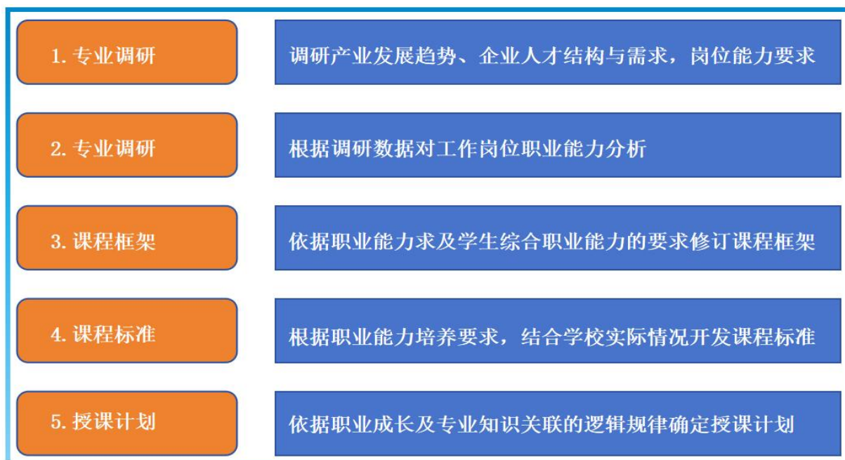
图1 课程体系构建思路