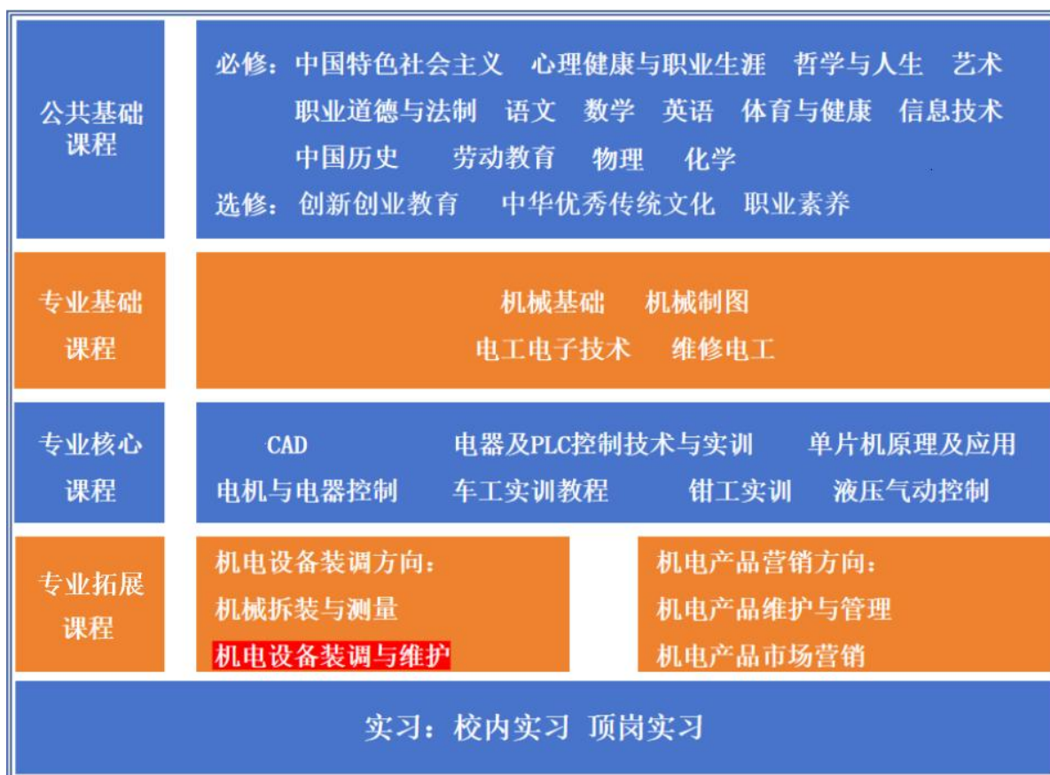
图2 课程体系结构图

将学习领域课程体系按公共基础课程、专业基础课程、专业核心课程、专业技能（方向）课程和实习（包括校内实习和校外顶岗实习）五大模块构成本专业课程体系，其中公共基础课模块主要对应于培养文化基础知识、职业道德和职业素养，专业基础课程、专业核心